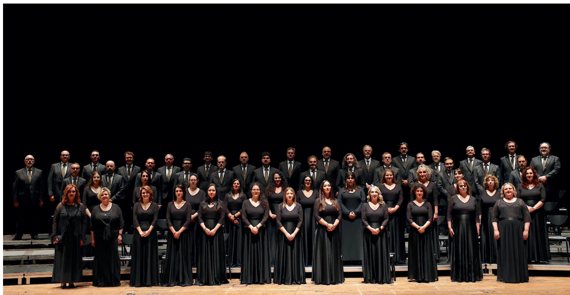
Coro del Teatro Carlo Felice di Genova