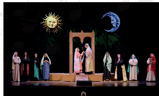
L'Arca di Noè

Orchestra Sinfonica di Savona: è una feconda realtà culturale savonese fondata nel 1992, con sede presso il Teatro Chiabrera.