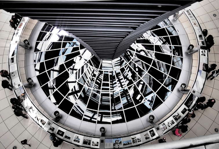
Berlino. Cupola del Reichstag.