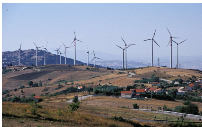
CAMPANIA, Frigento (AV), centrale eolica in prossimità di case e di elettrodotti (si noti la palese diversità di impatto tra una pala eolica e un elettrodotto)